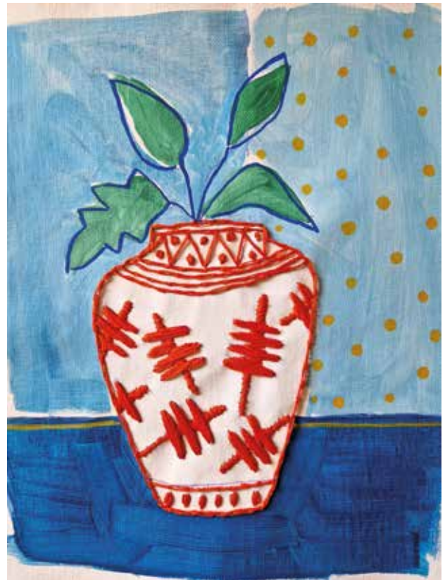
Nasljedstvo , kombinirana tehnika: akril na platnu, ručni vez koncem, 25x30 cm, 2023.