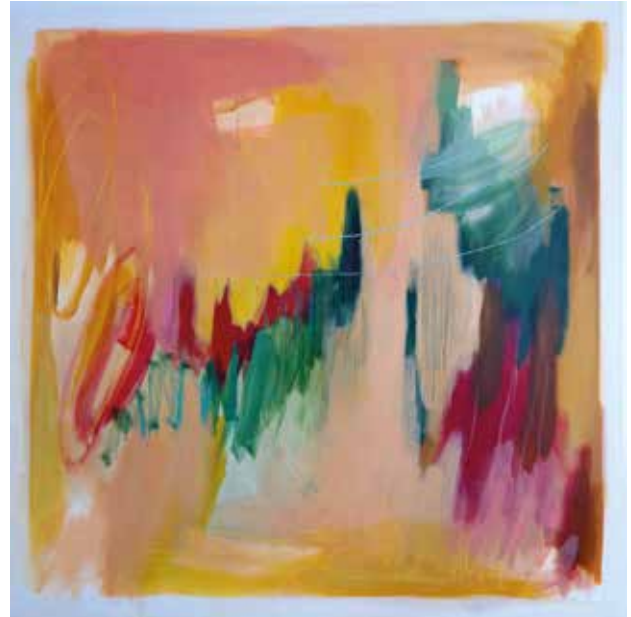
Sentimentalni vetrovi , kombinirana tehnika: akril na platnu, ručni vez koncem, 100x100 cm, 2023.