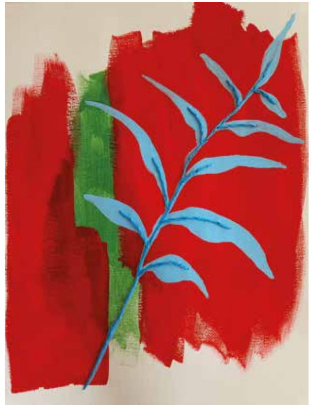
Mudro zboriti , kombinirana tehnika: akril na platnu, ručni vez koncem, 25x30 cm, 2023.