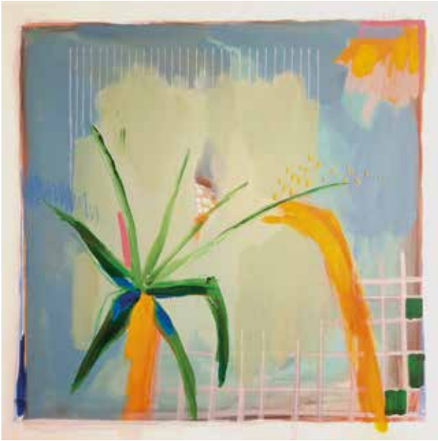
Immortelle , kombinirana tehnika: akril na platnu, ručni vez koncem, 100x100 cm, 2023.