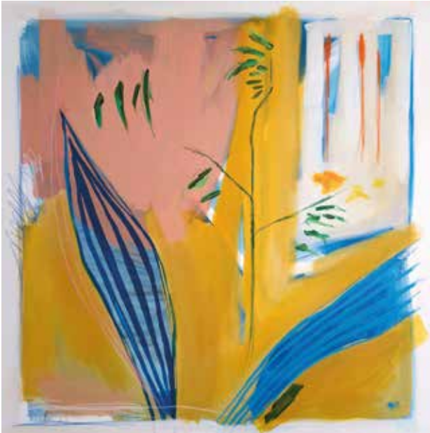
Oda spoznaji , kombinirana tehnika: akril na platnu, ručni vez koncem, 100x100 cm, 2023.