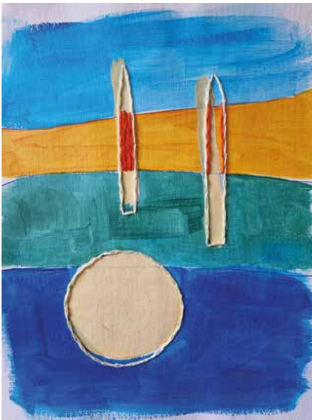
Kafić na kraju svijeta , kombinirana tehnika: akril na platnu, ručni vez koncem, 25x30 cm, 2023.