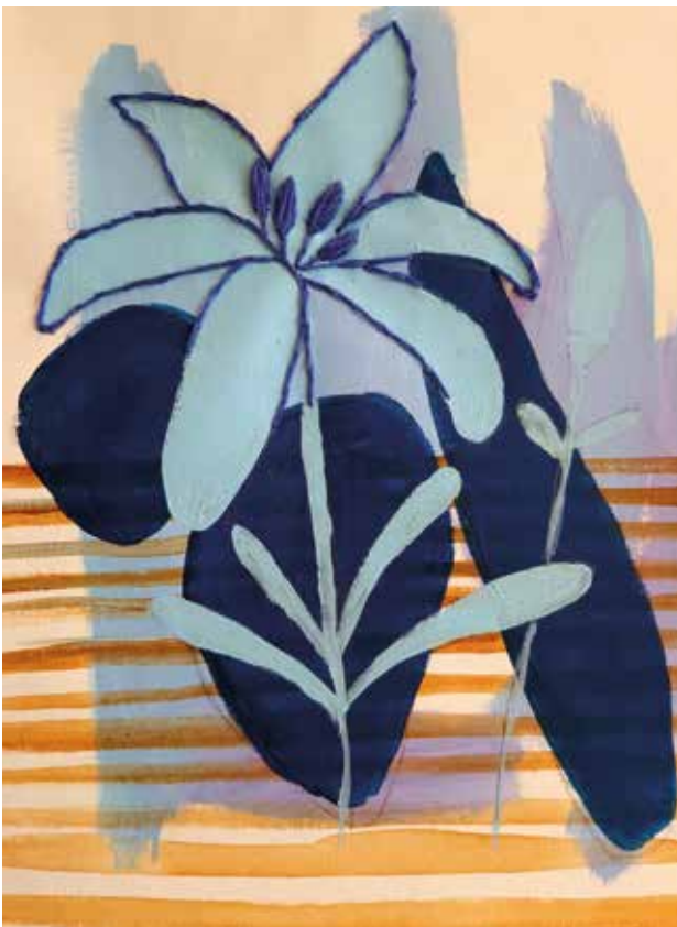
Oda ljubavi , kombinirana tehnika: akril na platnu, ručni vez koncem, 25x30 cm, 2023.