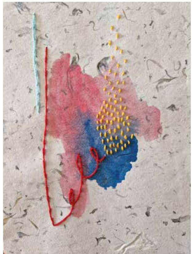
Rad iz serije "intuitivne valorizacije", tehnika: akril na recikliranom papiru i ručni vez koncem, 15x21 cm, 2023.