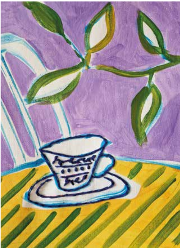
Trenutak mira , kombinirana tehnika: akril na platnu, ručni vez koncem, 25x30 cm, 2023.