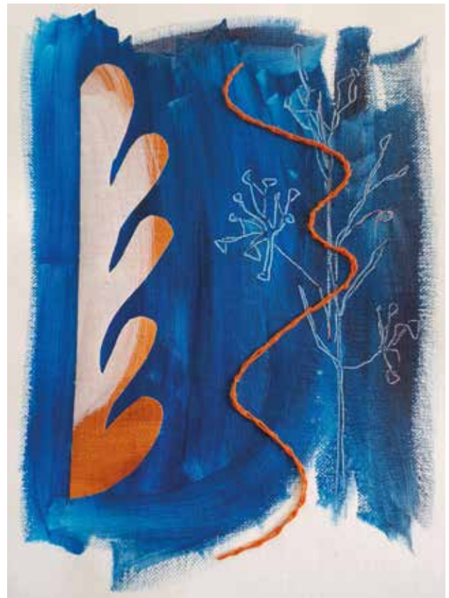
Pročiščenje , kombinirana tehnika: akril na platnu, ručni vez koncem, 25x30 cm, 2023.