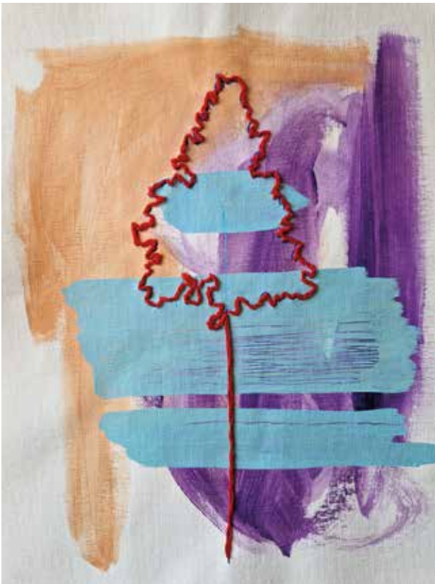
Na reveru tamni jorgovan , kombinirana tehnika: akril na platnu, ručni vez koncem, 25x30 cm, 2023.