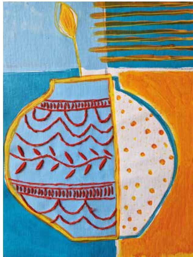
Ustrajnost , kombinirana tehnika: akril na platnu, ručni vez koncem, 25x30 cm, 2023.