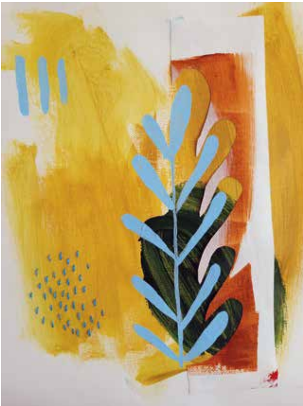
Hommage Matisseu , kombinirana tehnika: akril na platnu, ručni vez koncem, 25x30 cm, 2023.